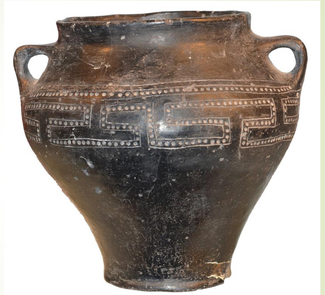
Kolonia Bodzanowska (d. Adolfin), pow. aleksandrowski; urna z cmentarzyska kultury przeworskiej, warsztat lokalny, I w. n.e

Dla współcześnie żyjących ludzi ulepienie naczynia wymaga znajomości wyłącznie technologii i techniki jego wytwarzania. Dla wytwórców z dawnych epok taka wiedza była tylko jednym z elementów procesu formowania gliny. Równie ważnymi dla dawnych garncarzy były gest, słowo czy inkantacja, ponieważ – jak wierzą – bez nich nie mógł powstać żaden w pełni funkcjonalny przedmiot. Wytwarzanie, nawet zwykłych dla nas garnków, stanowiło, oprócz procesu technologicznego, także pewnego rodzaju magiczny obrzęd. Obydwa te aspekty – technologiczny i magiczny były niezbędne do zaistnienia przedmiotu – pozwalały na powstanie wytworu zarówno w wymiarze fizycznym, jak i duchowym.