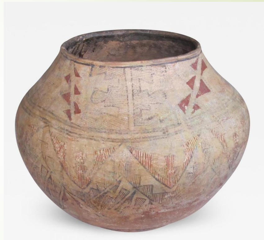
Naczynie ceramiczne Indian Zuni, XIX w.

L. Lévy-Bruhl, Czynności umysłowe w społeczeństwach pierwotnych, 1922, s. 62