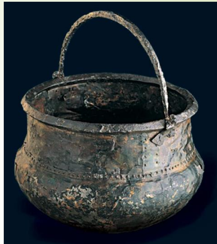
Urna (stop miedzi) z cmentarzyska kultury przeworskiej; import celtycki, I w. n.e., fot. B. Walkiewicz

Zbiory Muzeum Archeologicznego w Poznaniu