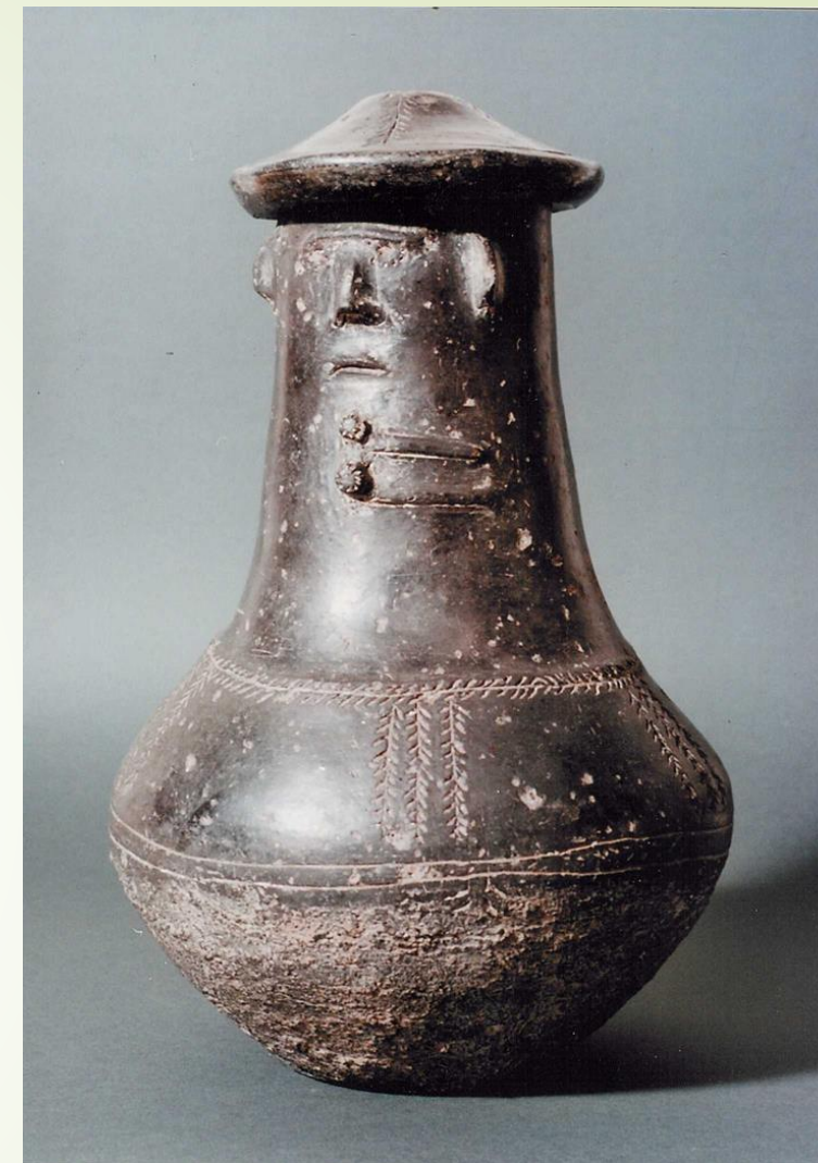
Żelewo, pow. wejherowski. Urny twarzowe kultury pomorskiej, VI-V w. p.n.e.; warsztat lokalny, fot. K. Deczyński

Wg Kolekcja archeologiczna Muzeum Towarzystwa Naukowego w Toruniu w zbiorach Muzeum Okręgowego w Toruniu. Katalog, red. P. Guzyński, Toruń 2019.