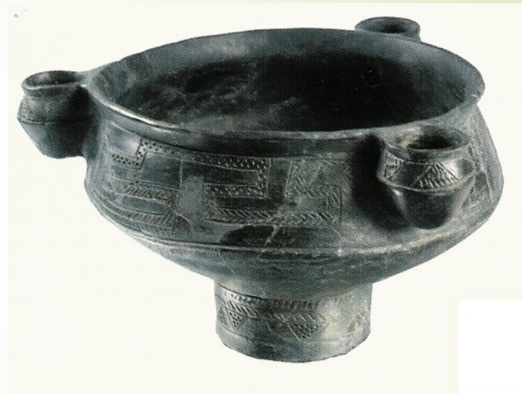
Garwolin, naczynie w typie greckiego kernosu – urna z cmentarzyska kultury przeworskiej, warsztat lokalny, II w. n.e

Wg: Słownik etnologiczny. Terminy ogólne, Z. Staszczak (red.), Warszawa-Poznań 1987