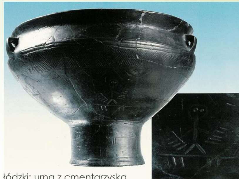
Biała, pow. łódzki; urna z cmentarzyska kultury przeworskiej; warsztat lokalny, II w. n.e.

W niektórych językach używa się podobnych słów na oznaczenie garnka i paleniska przeznaczonych do rytuałów poświęconych bogom. Może to oznaczać, że obydwa te obiekty – garnek i palenisko – w szczególnych sytuacjach były traktowane jako niezbędne do kontaktów ze światem nadprzyrodzonym. Obecność swastyki – uznawanej za symbol ognia – na widocznych powierzchniach naczyń, jak i na dnach, może potwierdzać powyższą interpretację.