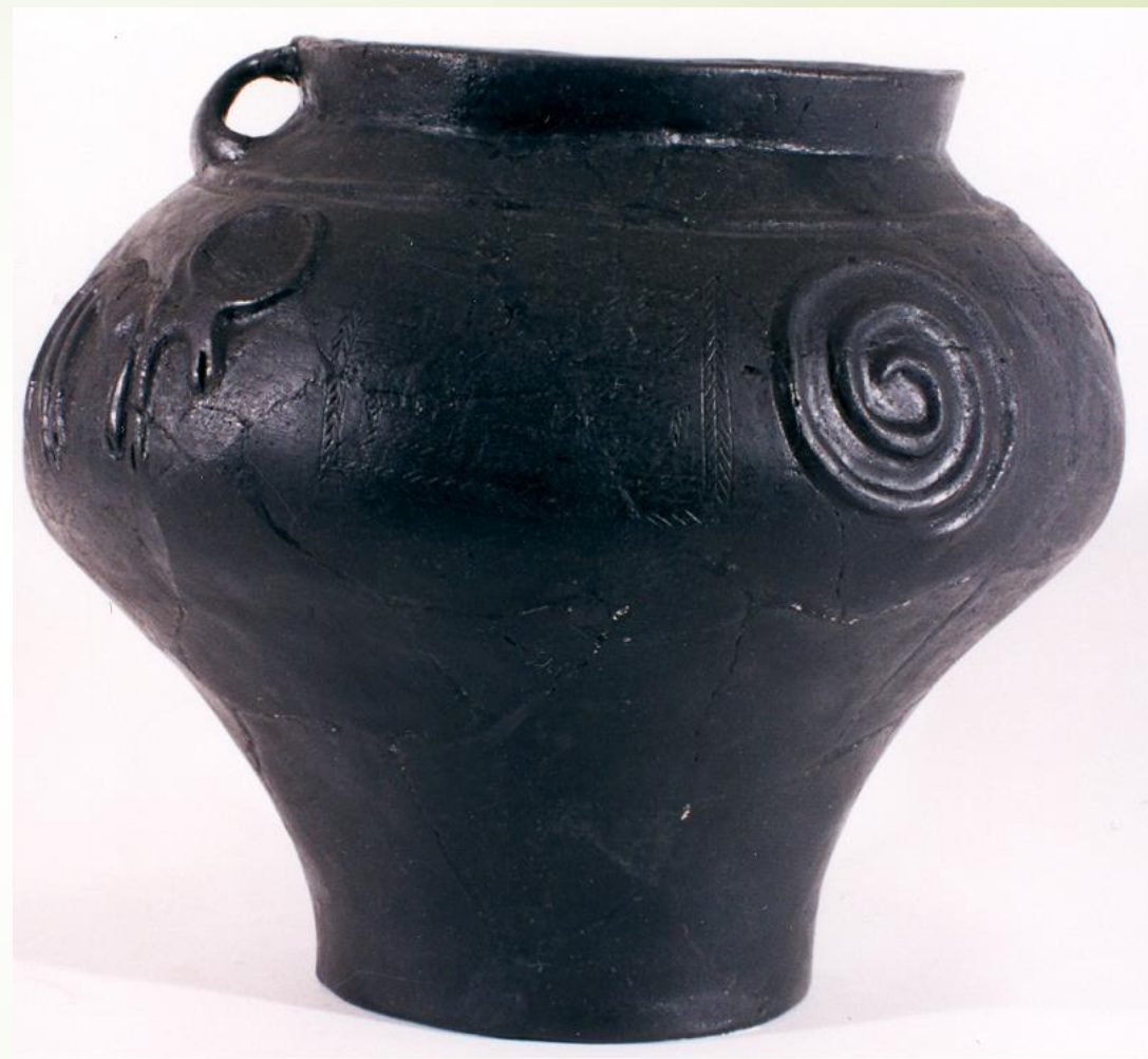
Gołębiewo Wielkie, pow. gdański; urna z cmentarzyska kultury oksywskiej, warsztat lokalny, I w. n.e,