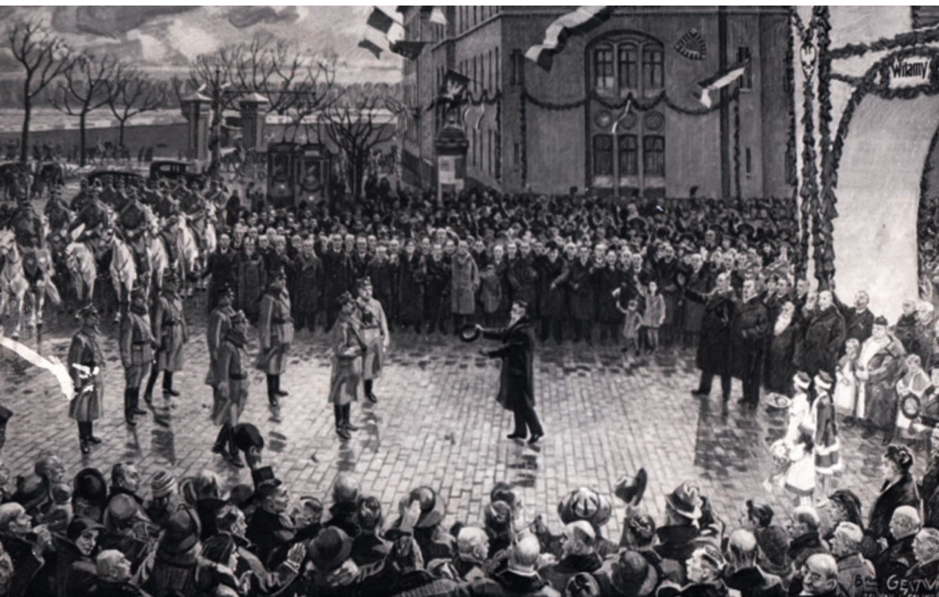
Powitanie wojsk polskich przed Dworcem Miasto w Toruniu, rep. obrazu F. i B. Gęstwickich