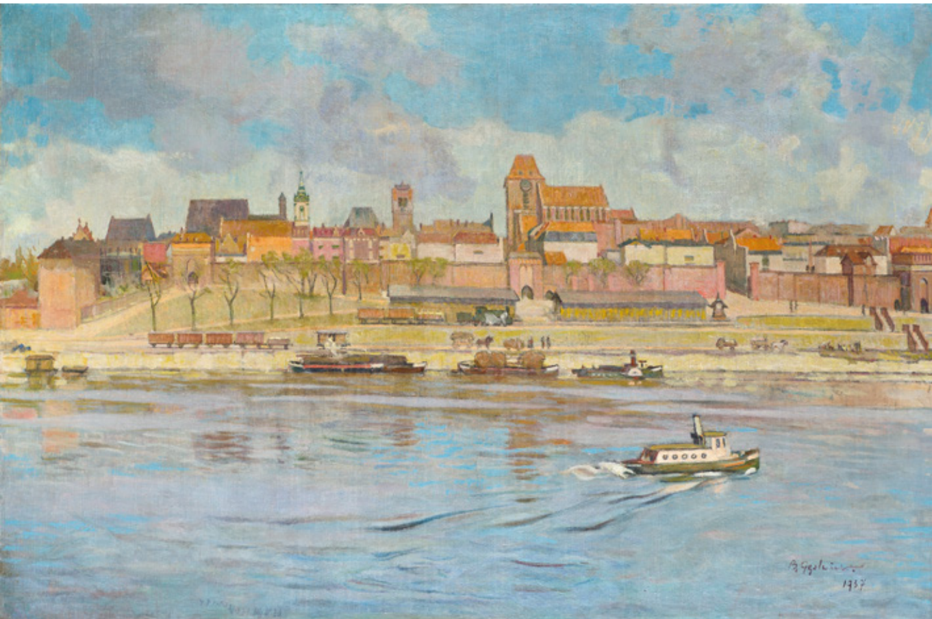
B. Gęstwicki, Panorama Torunia , 1937 r., ze zbiorów MOT, fot. K. Deczyński