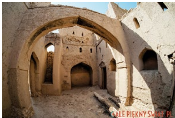
Zdjęcie z podróży Doroty Chojnowskiej