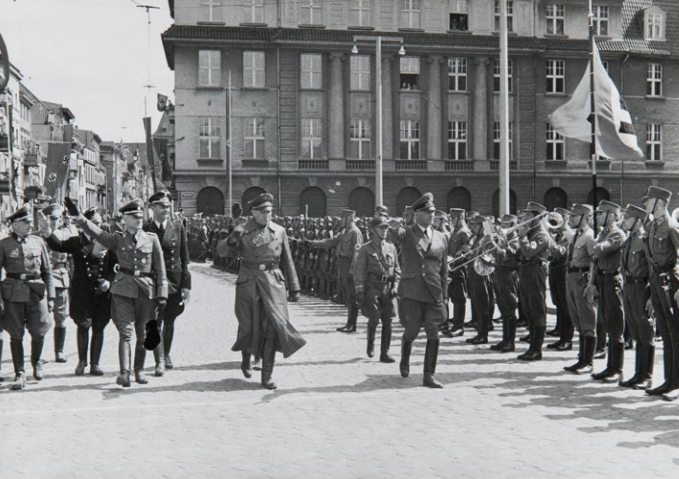
Wizyta w Toruniu ministra spraw wewnętrznych Rzeszy Wilhelma Fricka (z prawej). Defilada na pl. Teatralnym, fot. Kurt Grimm, 21 czerwca 1942 r., ze zbiorów Muzeum Okręgowego w Toruniu.