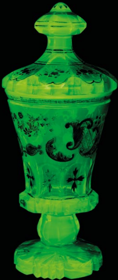
Ekspонат z kolekcji Ambasadora Peru