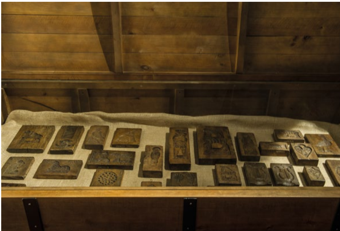
Historyczne formy piernikarskie ze zbiorów Muzeum Okręgowego w Toruniu

cji piernikarskich w naszym mieście, z dumą podkreślając rolę Torunia w „piernikowej historii Europy”.